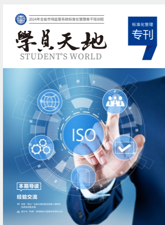
标准化管理骨干培训班专刊

指导处室：湖北省市场监督管理局标准化处 湖北省市场监督管理局人事处 主办单位：湖北省市场监督管理宣传教育中心 编辑：田园 黄敏 美术编辑：刘孝成 中心地址：湖北省武汉市武昌区中北路20号 白鹭街西段 邮政编码：430071 联系电话：400-0800-666 官方网址：www.hbmtc.org.cn 学习平台：www.mreln.com