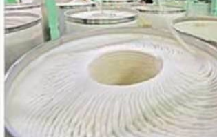
内蒙古采取5项措施推动企业开办便利化高效化

【本报呼和浩特4月8日电】为优化营商环境，降低企业开办成本，提高企业开办效率，内蒙古自治区市场监管局近日在全省范围内推行企业开办便利化高效化措施。这5项措施包括：推行网上开办、推行一窗受理、推行一网通办、推行一证一码、推行一址一照。通过这5项措施，企业开办时间大幅缩短，开办成本显著降低，营商环境得到了进一步优化。